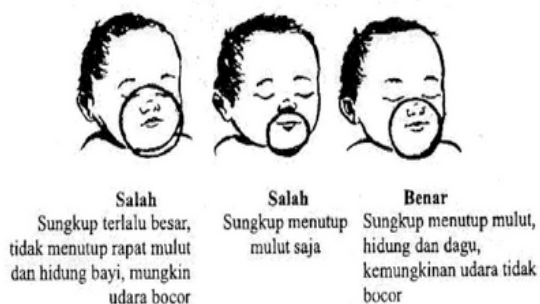
Gambar cara memasang sungkup

Pasang dan pegang sungkup agar menutupi dagu, mulut dan hidung.