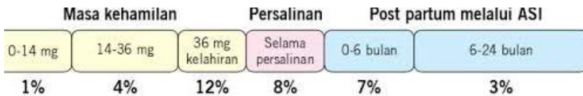
Gambar 2.2. Risiko Penularan HIV dari Ibu ke Anak saat hamil, bersalin dan menyusui